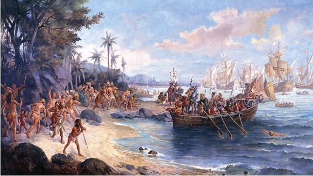
პედრუ ალვარიშის ექსპედიცია წმინდა ჯვრის კუნძულთან

1500 წლის აპრილში პორტუგალიელთა ესკადრა კაპრალ პედრუ ალვარიშის მეთაურობით პორტუგალიიდან კოლუმბის მიერ აღმოჩენილ “ინდოეთში” გაემგზავრა. ის ეკვატორის მახლობლად უქარო სივრცეში მოხვდა და დინებამ შორს, დასავლეთისკენ წაიღო. პორტუგალიელები უცხო მიწას მიადგნენ, რომელიც მათ კუნძული ეგონათ. კაპრალმა სანაპიროზე ხის ჯვარი აღმართა და ახალ მიწას წმინდა ჯვრის კუნძული (Terra da Santa Cruz) უწოდა.