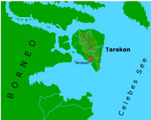
ტარაკანი ინდონეზიის აღმოსავლეთში მდებარე პატარა კუნძული და ქალაქია

გეოგრაფიულ ობიექტებს ხშირად ადამიანთა სახელები ჰქვია. მაგალითად, არსებობს მდინარეები ლენა, იანა, ლინდა, იურა, ოლგა, ლიდა, ვერა, სონა, მაგდალენა, მარგარიტა და სხვა.