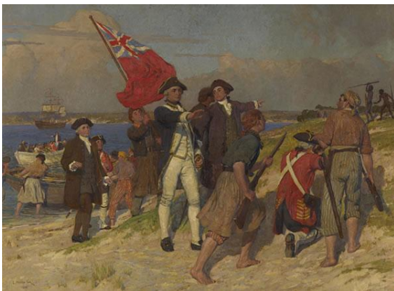
ბოტანიკის (ბოტანის) ყურე 1770 წელს ჯეიმს კუკის ექსპედიციამ აღმოაჩინა. კუკმა მას დედამიწის გარშემო თავისი პირველი მოგზაურობის მონაწილეთა პატივსაცემად დაარქვა ასე.

ავსტრალიის დასავლეთ სანაპიროზე მდებარეობს ნატურალისტის კონცხი და გეოგრაფის ყურე. მათ ეს სახელები იმ გემების პატივსაცემად ეწოდათ, რომლებმაც ისინი აღმოაჩინეს. ავსტრალიის აღმოსავლეთ სანაპიროზე კი ვხვდებით ბოტანიკის (იმავე ბოტანის) ყურეს. დროთა განმავლობაში ამ ყურეში ქ. სიდნეი დაარსდა.