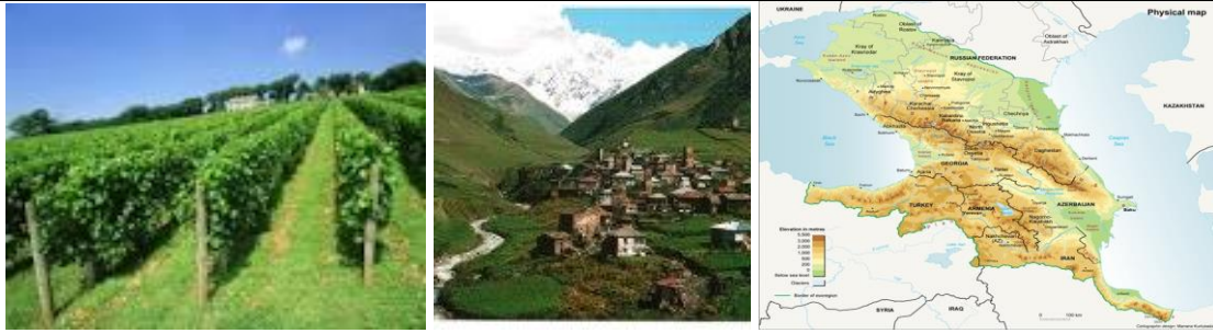
ვენახი მთიულეთი საქართველოს რუკა