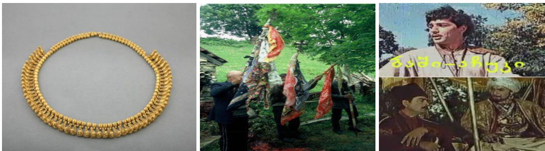
ვანის მონაპოვარი ხატობა მთაში კადრი ფილმიდან