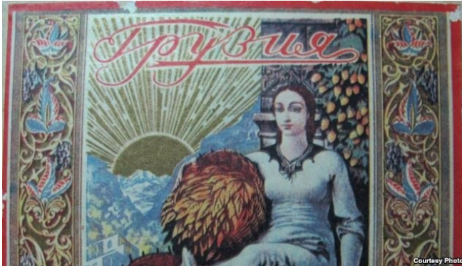
გუდიაშვილის ნახატი 2